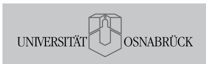
Logo der Universität Osnabrück in schwarz/weiß

Das offizielle Logo der Universität Osnabrück liegt in mehreren Varianten vor. Die Benutzung ist ausschließlich für dienstliche Belange der Universität Osnabrück gestattet. Das Logo setzt sich aus dem Bildzeichen der Universität und dem Schriftzug »Universität Osnabrück« zusammen. Die Fondfläche fasst die Wort-/Bild-Marke zusammen.